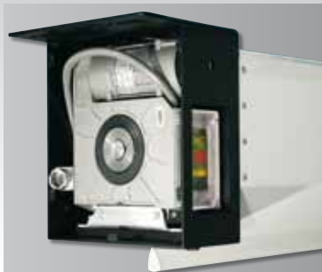
Elektroantrieb nach Theaterstandard (BGV C1) zertifiziert.