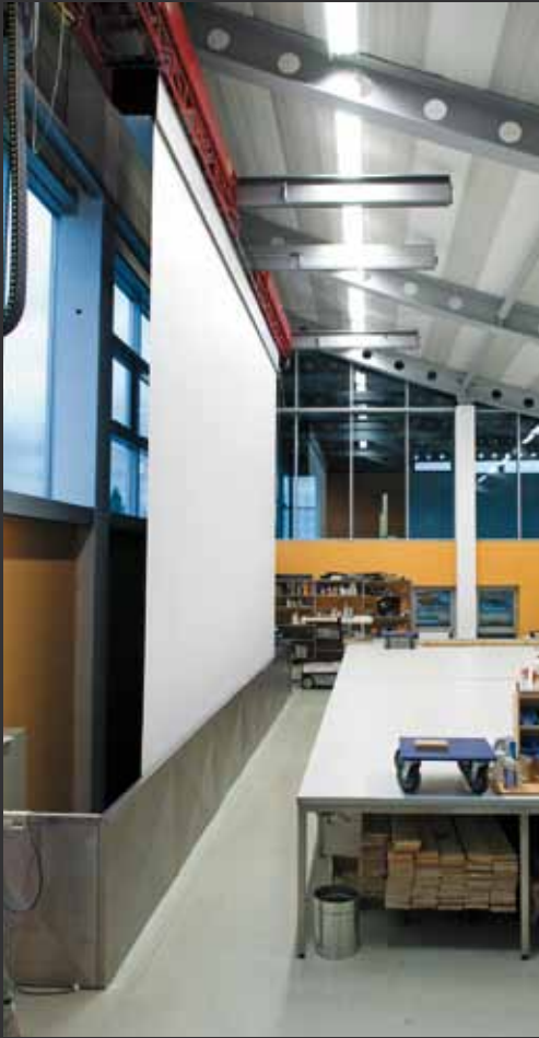
Endkontrolle einer MAGNUM in der AV Stumpf Factory.