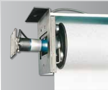
Antrieb mit Schnellwechselkupplung ermöglicht Motortausch ohne Demontage der Bildwand.