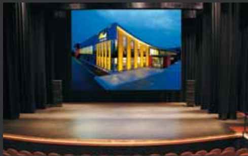
MAGNUM 900 x 700 cm im Theater in Houten, Holland.