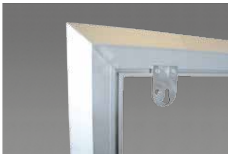
Aufhängepunkt für Wandmontage - horizontal montiert.