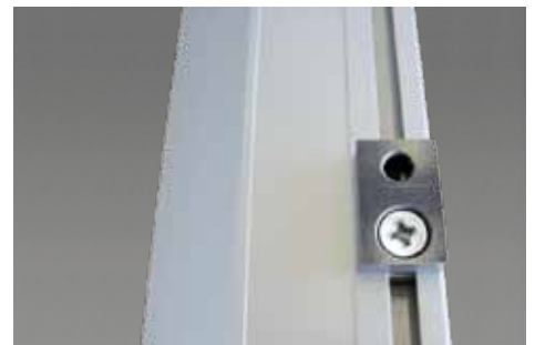
Befestigungspunkt mit M8-Gewindeeinsatz.