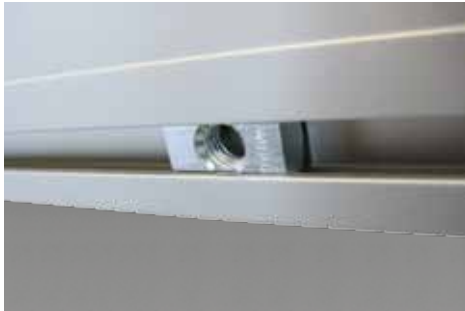
Die Einschwenkmutter dient als Grundbefestigung für die verschiedenen Beschläge.

Die universellen Beschläge können am Rahmen variabel positioniert werden und ermöglichen verschiedenste Montagevarianten. Für ein optimales Projektionsergebnis wird die Projektionsfolie gerollt geliefert. Gerne erstellen wir Ihnen für Ihre jeweiligen Anforderungen ein Angebot.