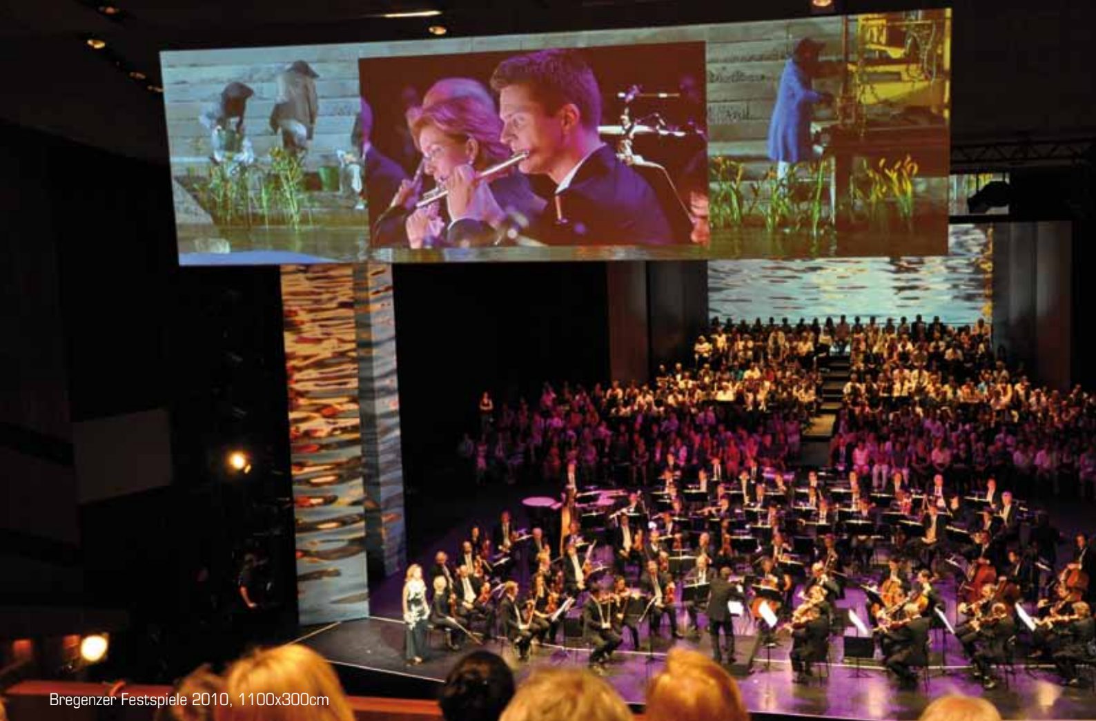
Bregenzer Festspiele 2010, 1100x300cm

Die universellen Beschläge können am Rahmen variabel positioniert werden und ermöglichen verschiedenste Montagevarianten. Für ein optimales Projektionsergebnis wird die Projektionsfolie gerollt geliefert. Gerne erstellen wir Ihnen für Ihre jeweiligen Anforderungen ein Angebot.