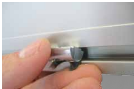
Einbau einer Einschwenkmutter in das Nutensystem auf Rahmenrückseite.