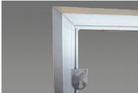
Aufhängepunkt für Wandmontage - vertikal montiert.