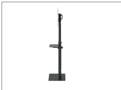
asymmetrische Bodenplatte erlaubt eine Positionierung nah an der Wand