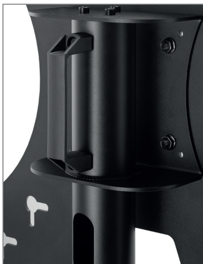
inkl. Griff auf der Säulenrückseite