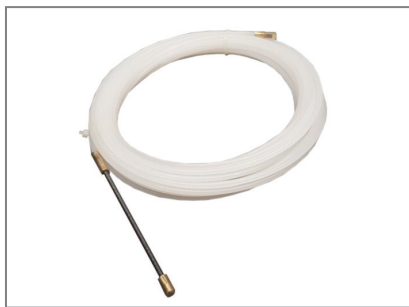
inkl. praktischer Kabeldurchzugshilfe