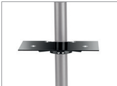
Optional: Braclabs-Stand Frontshelf (Art.-Nr.: 1984)